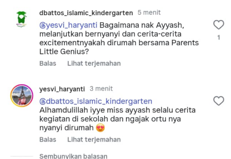
Gambar 3.3. Interaksi Pihak TK & Orangtua di Media Sosial Instagram

Berdasarkan pada keterangan yang diberikan oleh guru kelas senior (sebutan untuk kelompok belajar untuk usia 5-6 tahun) diterangkan bahwa selain strategi kolaborasi komunikasi, baik langsung maupun melalui media sosial, guru kelas juga secara rutin menyampaikan perkembangan anak pada tiap momentum pertemuan orang tua dalam program rutin TK. Miss Suryawardani memberikan keterangan, sebagai berikut: