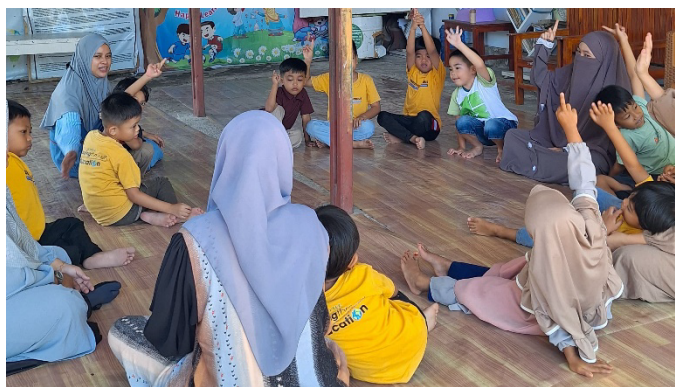
Gambar 3.1. Aktivitas Pembelajaran Outdoor “Talk Little Genius”