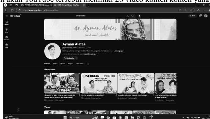
Gambar 1. Tampilan muka YouTube @AymanAlatas

YouTube merupakan platform media sosial yang memfasilitasi pengguna untuk menonton dan mengupload video, berbagai jenis konten video yang terdapat dari YouTube mulai dari hiburan, wawasan, serta berita, dikutip dari (Wiryany, A. Yanuar Idris 2018). Pada akun YouTube Ayman Alatas terlihat memiliki 30,8 rb subscriber yang berisi konten-konten mengenai edukasi terkait dengan kesehatan wajah, kesehatan secara umum maupun kesehatan mental. dalam akun YouTube tersebut memiliki 28 video konten konten yang mengedukasi.