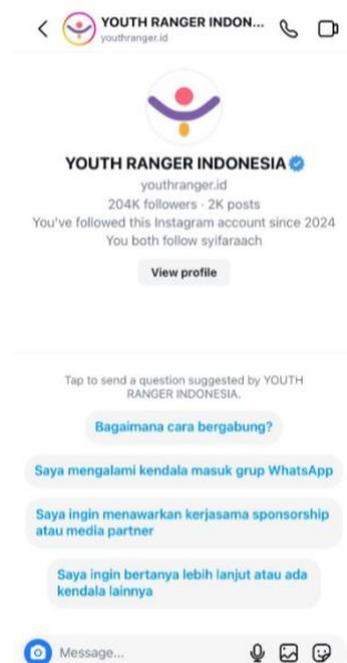
Gambar 3. Automatic Chat Instagram YRI

Selain itu, informasi juga disebarakan melalui interaksi di kolom komentar setiap unggahan. Tim Humas YRI secara aktif menanggapi komentar untuk menjawab pertanyaan maupun memberikan klarifikasi terkait informasi yang dibagikan. Dengan pendekatan ini, pemirsa tidak hanya mendapatkan informasi yang komprehensif, tetapi juga meningkatkan kepercayaan dan keterlibatan mereka terhadap YRI. Melalui strategi ini, Instagram menjadi platform yang efektif dalam mendukung penyebaran informasi secara real-time dan interaktif.