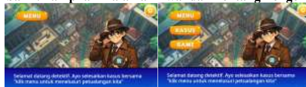
Gambar 3. Tampilan Halaman Menu Utama.