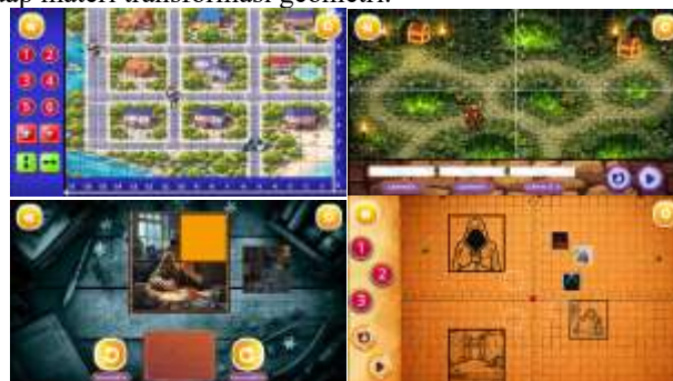
Gambar 6. Tampilan Game Translasi, Refleksi, Rotasi, dan Dilatasi

Pada setiap jenis permainan, tersedia empat level yang dirancang secara bertingkat untuk mendukung pemahaman siswa terhadap materi transformasi geometri.