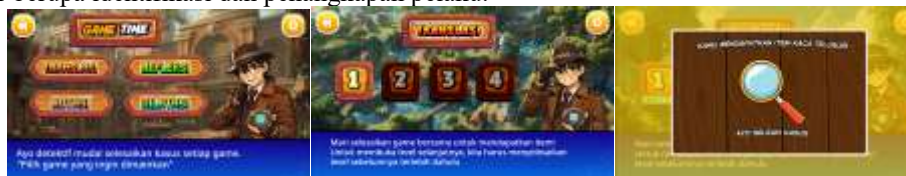
Gambar 5. Tampilan Menu Game, Pilihan Level, dan Item

Setiap kasus dalam game disajikan melalui visual naratif. Siswa diharuskan menyelesaikan misi dan mengumpulkan item sebagai petunjuk untuk membuka tahapan investigasi selanjutnya hingga mencapai tahap akhir berupa identifikasi dan penangkapan pelaku.