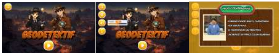
Gambar 2. Tampilan Halaman Awal dan Tentang Pengembang