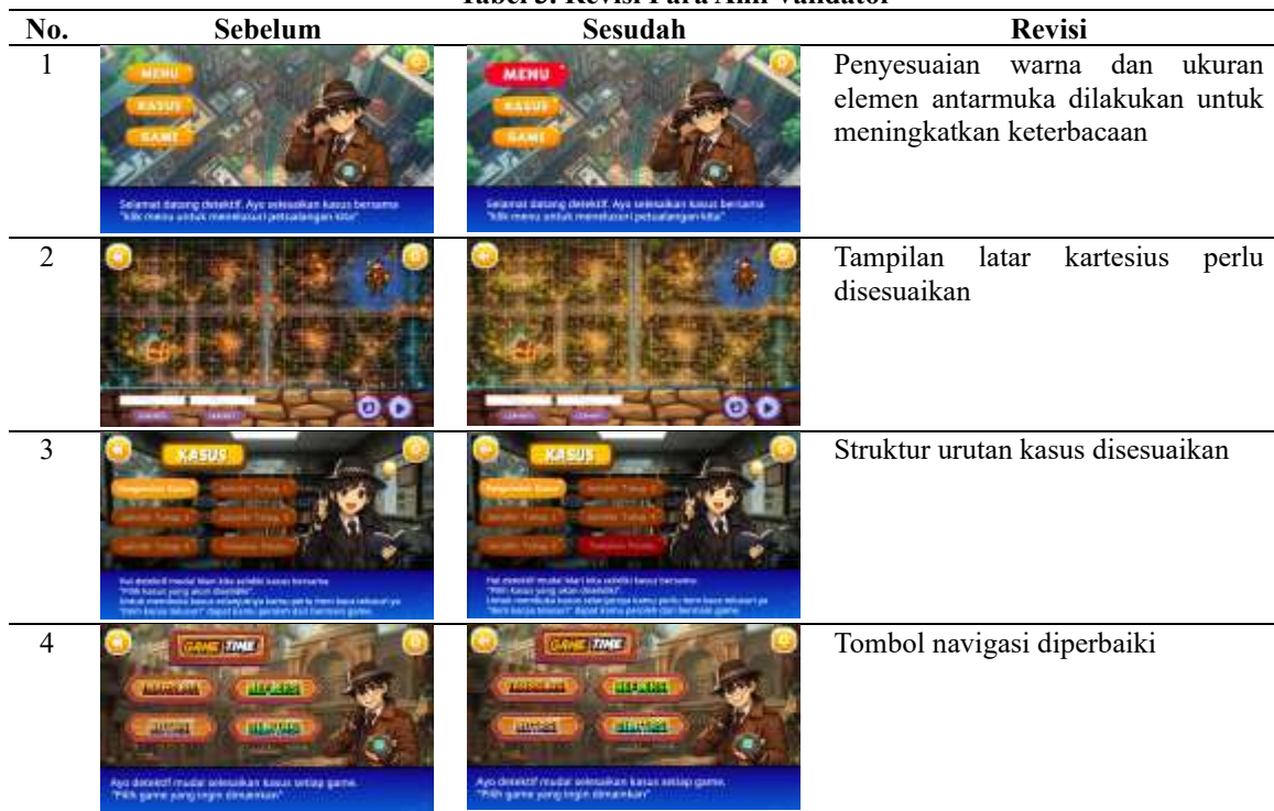
Tabel 3. Revisi Para Ahli Validator

Berdasarkan rekapitulasi hasil validasi media, dapat disimpulkan bahwa game edukasi yang dikembangkan layak digunakan dengan kategori sangat valid. Selain memberikan penilaian kuantitatif, para ahli media juga menyampaikan komentar dan saran sebagai bahan penyempurnaan produk. Adapun perbaikan yang dilakukan berdasarkan masukan para ahli disajikan secara rinci pada Tabel 3 berikut