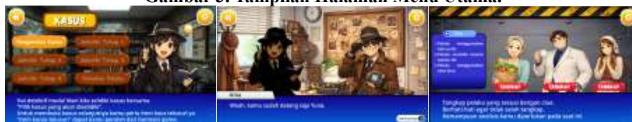
Gambar 4. Tampilan Halaman Kasus, Dialog Kasus, dan Penangkapan Pelaku.

Setiap kasus dalam game disajikan melalui visual naratif. Siswa diharuskan menyelesaikan misi dan mengumpulkan item sebagai petunjuk untuk membuka tahapan investigasi selanjutnya hingga mencapai tahap akhir berupa identifikasi dan penangkapan pelaku.