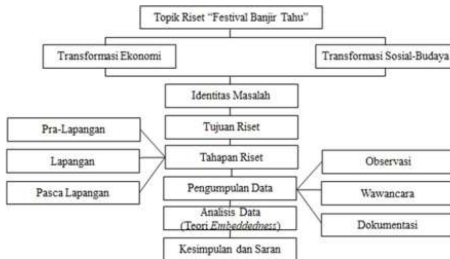
Gambar 1.1 Desain Riset

Pemilihan lokasi ini didasarkan pada relevansi dengan objek penelitian sebagai sentra produksi tahu dan pusat penyelenggaraan FBT. Adapun desain riset adalah sebagai berikut: