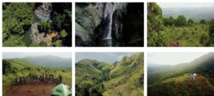
Gambar 2. Wisata Alam di sekitar Desa Awang Bangkal Timur

Keindahan alam pegunungan Meratus yang mengelilinginya, kekayaan budaya lokal, serta aktivitas masyarakat yang masih lekat dengan tradisi dan kehidupan agraris, merupakan daya tarik tersendiri bagi wisatawan domestik maupun mancanegara. Selain itu, semangat masyarakat setempat untuk menjadikan desanya sebagai destinasi wisata terlihat dari inisiatif-inisiatif lokal. Di Desa Awang Bangkal Timur, Kecamatan Karang Intan, Kabupaten Banjar, lokasi wisata Palawangan baru-baru ini menarik perhatian. Dengan beberapa bukit seperti Bukit Palawangan, Bukit Batu Betabang, Bukit Panangah, dan Puncak Matang Pipih, serta air terjun dan pemandangan matahari terbit dan terbenam yang indah, destinasi ini memiliki daya tarik tersendiri bagi para pendaki dan pecinta alam. Sejak dibuka secara resmi pada bulan Desember 2024 di bawah kelompok wisata lokal (Pokdarwis), jumlah pengunjung akhir pekan dan hari libur telah meningkat secara signifikan.