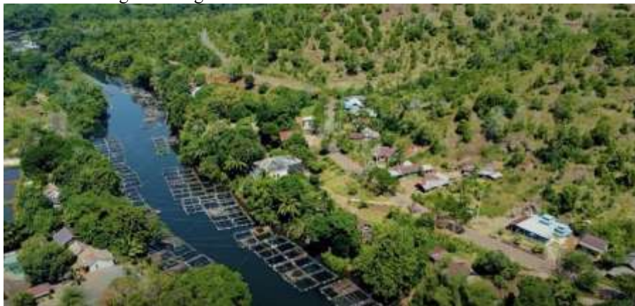
Gambar 1. Wilayah Desa Awang Bangkal Timur Kabupaten Banjar Kalimantan Selatan

Indonesia sebagai negara agraris dan kepulauan memiliki ribuan desa yang menyimpan potensi pariwisata luar biasa, baik dari segi alam, budaya, kuliner, hingga kerajinan tangan. Salah satu wilayah yang memiliki potensi tersebut adalah Desa Awang Bangkal Timur. Desa Awang Bangkal Timur yang terletak di Kecamatan Karang Intan, Kabupaten Banjar, Kalimantan Selatan, merupakan salah satu desa yang memiliki potensi besar untuk dikembangkan sebagai desa wisata.