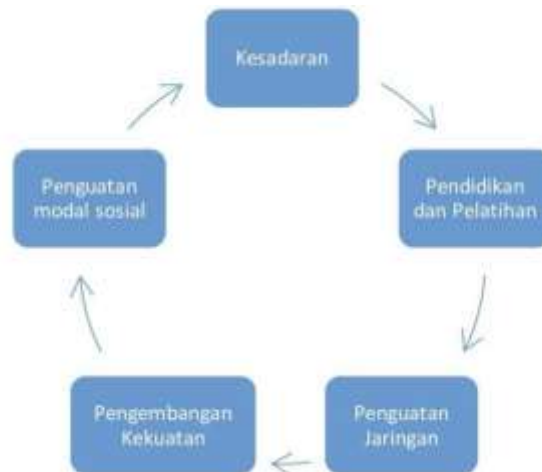
Gambar 3. Community Empowerment Framework

Pemberdayaan masyarakat ( community empowerment ) menjadi kunci utama dalam upaya mewujudkan pariwisata desa yang inklusif dan berkelanjutan (Devi & Rahaju, 2025). Melalui pemberdayaan, masyarakat tidak hanya dijadikan sebagai objek pembangunan, tetapi juga sebagai subjek utama yang berperan aktif dalam mengidentifikasi potensi, merencanakan program, serta mengelola aset wisata secara mandiri (Afriansyah et al. 2022). Terdapat lima prinsip utama yang menjadi landasan dalam mengoptimalkan proses penguatan serta pemberdayaan masyarakat untuk mencapai kemandirian, kesejahteraan, dan partisipasi aktif, yaitu melalui peningkatan kesadaran, penyelenggaraan pendidikan dan pelatihan, penguatan jaringan, serta penguatan modal sosial (Putri, 2019).